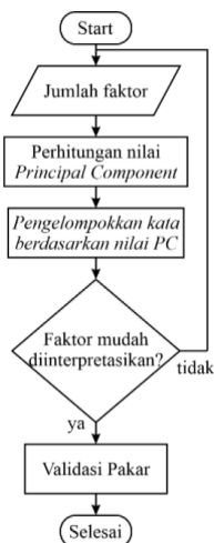
Gambar 3. Proses analisis faktor

Tahap analisis faktor dapat dilakukan secara langsung karena analisis faktor pada penelitian ini menggunakan data latih. Jumlah faktor dapat ditentukan oleh pengguna dan hasil pengelompokan ditampilkan berdasarkan jumlah faktor yang dimasukkan. Jika hasil pengelompokan masih kurang sesuai, pengguna dapat mengubah masukan jumlah faktor hingga muncul hasil yang diinginkan. Proses ini dapat dilakukan dengan bantuan pakar untuk melakukan validasi dari faktor yang terbentuk. Proses analisis faktor dapat dilihat pada gambar 3.