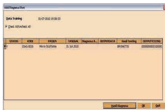
Gambar 3. Form pengujian