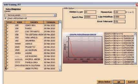
Gambar 2. Form pelatihan