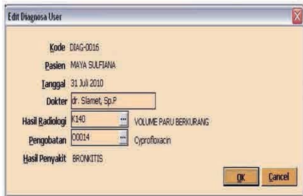
Gambar 4. Form hasil diagnosa