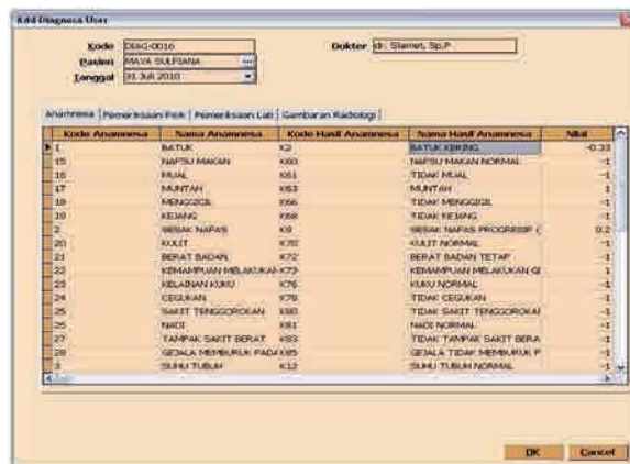
Gambar 1. Form diagnosa pasien

Untuk mendapatkan hasil yang berupa diagnosa penyakit dan pengobatannya maka pengguna harus melakukan pengujian (gambar 2). Pada contoh kasus di atas setelah dilakukan pengujian ternyata pasien menderita penyakit bronchitis (gambar 3).