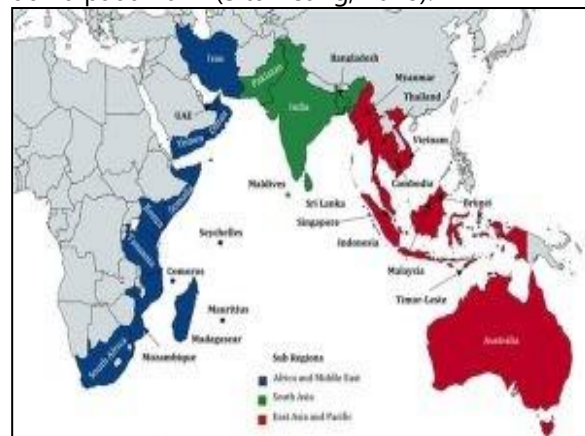
Gambar 2. Potensi Ekonomi Samudera Hindia

Berdasarkan data dari LKI Sri Lanka, Samudra Hindia memiliki 16,8% cadangan minyak terbukti dunia dan 27,9% cadangan gas alam terbukti. Ekonomi Samudra Hindia menyumbang 35,5% dari produksi besi global dan 17,8% dari produksi emas dunia pada 2017 (Situmeang, 2018).