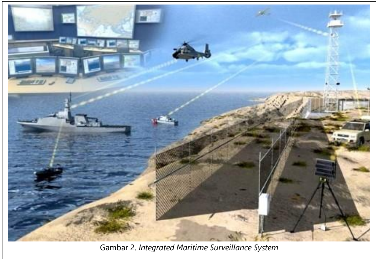
Gambar 2. Integrated Maritime Surveillance System

Berdasarkan data dari LKI Sri Lanka, Samudra Hindia adalah rumah bagi rute laut utama yang menghubungkan Timur Tengah, Afrika, dan Asia Timur dengan Eropa dan Amerika. Rute laut yang vital ini memfasilitasi perdagangan maritim di wilayah Samudra Hindia, mengangkut lebih dari setengah minyak yang ditanggung laut dunia, dan menampung 23 dari 100 pelabuhan peti kemas teratas dunia. Lalu lintas peti kemas melalui pelabuhan-pelabuhan di kawasan ini telah meningkat empat kali lipat dari 46 juta TEU pada 2000 menjadi 166 juta TEU pada 2017. Kebebasan navigasi sangat penting untuk kelancaran perdagangan maritim Samudera Hindia tetapi ancaman seperti persaingan di antara kekuatan besar, ancaman keamanan nontradisional, dan degradasi lingkungan tetap ada. Pembajakan dan perdagangan narkoba mendapatkan daya tarik di wilayah tersebut. Pada 2012, 200 kg heroin diperdagangkan di jalur perdagangan maritim Samudera Hindia.