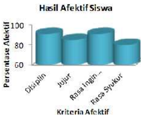
Gambar 3. Grafik afektif siswa

mencerminkan nilai-nilai kehidupan dan melekat pada diri seseorang (Rohman, 2012). Kemampuan afektif yang diimplementasikan dalam pembelajaran bertujuan membentuk karakter siswa, hal ini sesuai dengan pernyataan Mulyasa (2013) bahwa penilaian karakter dimaksudkan untuk mendeteksi karakter yang terbentuk dalam diri peserta didik melalui pembelajaran. Pada penelitian ini yang diamati adalah aspek kedisiplinan jujur, rasa ingin tahu, dan rasa syukur yang sesuai dengan grafik berikut