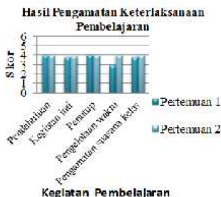
Gambar 1. Grafik keterlaksanaan pembelajaran

Kegiatan penutup, guru bersama-sama dengan siswa membuat rangkuman/simpulan pelajaran; memberikan umpan balik terhadap proses dan hasil pembelajaran; memberikan tugas baik tugas individual maupun kelompok sesuai dengan hasil belajar peserta didik; menyampaikan rencana pembelajaran pada pertemuan berikutnya. Hasil dari pengamatan keterlaksanaan rencana pelaksanaan pembelajaran (RPP) selama pembelajaran kooperatif dengan pendekatan scientific dapat dilihat pada grafik di bawah ini: