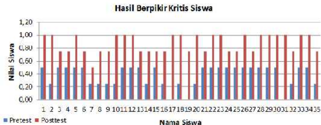
Gambar 4. Grafik berpikir kritis siswa

Berdasarkan hasil analisis berpikir kritis didapatkan satu siswa yang mendapatkan peningkatan rendah, hal ini kemungkinan dikarenakan beberapa faktor. Salah satu faktor yang dapat menyebabkan ketrampilan berpikir kritis rendah yaitu frekuensi pertemuan pada penelitian ini yang hanya dilakukan sebanyak dua kali pertemuan. Seharusnya untuk melatih berpikir kritis memerlukan waktu yang lebih lama, agar siswa terbiasa terlatih dengan pertanyaan-pertanyaan yang sifatnya menantang buat siswa untuk mengemukakan pendapat sendiri sehingga ketercapaian berpikir kritis dapat berkategori tinggi semua. Hal ini sejalan dengan penelitian Riyanto (2013, bahwa hasil ketrampilan berpikir kritis bisa mendapatkan kategori tinggi pada setiap siswa apabila dilatihkan dengan cukup. Akan tetapi peningkatan kemampuan berpikir kritis siswa secara klasikal yang diukur menggunakan N-Gain sehingga diperoleh skor 0,79, yang artinya siswa mengalami peningkatan ketrampilan berpikir kritis setelah pembelajaran berlangsung. Hal ini sesuai dengan Hake 1999, siswa dikatakan mampu berpikir kritis apabila terdapat peningkatan hasil dari tes sebelum diberikan perlakuan ( pretest ) dan setelah diberikan perlakuan ( posttest ). Selain itu juga diperoleh hasil rerata