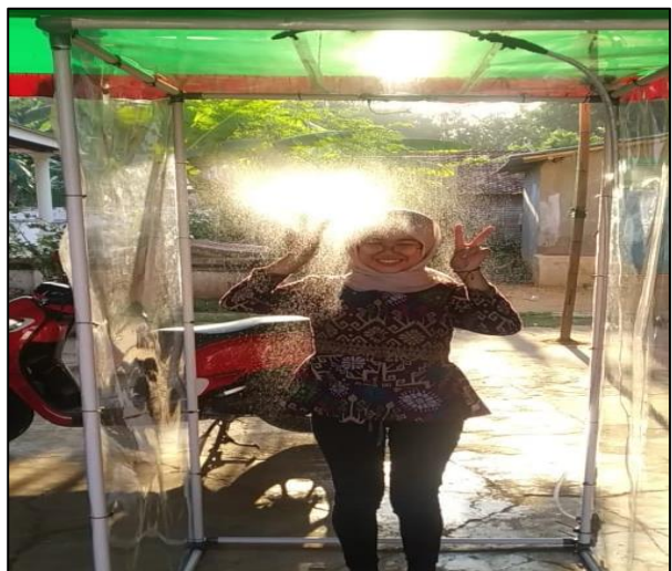
Gambar 5. Pengujian Alat Bilik Disinfektan Otomatis