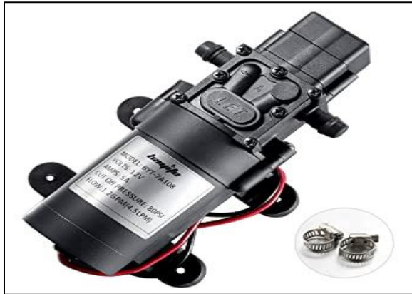
Gambar 1. Water Pump 12 V

Komponen yang digunakan untuk pembuatan alat ini diantaranya dijelaskan pada gambar-gambar dibawah ini :