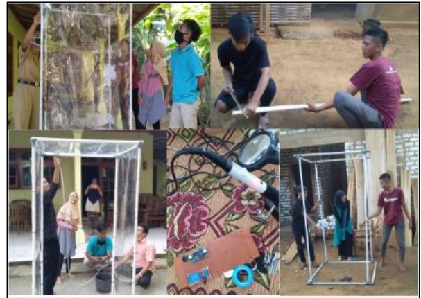
Gambar 4. Proses Pembuatan Alat Bilik Disinfektan Otomatis