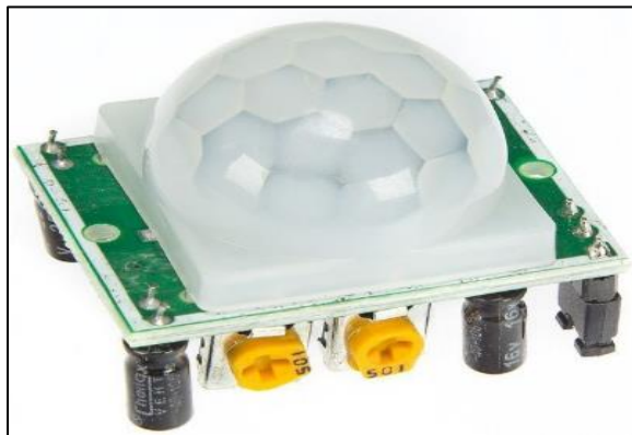
Gambar 2. Sensor PIR Tipe High