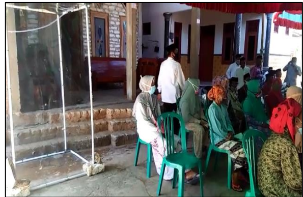
Gambar 6. Penggunaan bilik disinfektan otomatis di Balai Desa Banjar Barat Kec. Gapura

Aspek manfaat yang dapat diterima adalah ketersediaan alat untuk mendukung pencegahan Covid-19 di Desa Banjar Barat. Kegiatan ini menghasilkan output yang dapat berguna bagi desa sebagai pelengkap sarana pemutusan penyebaran Covid-19 di Desa Banjar Barat yang juga dapat dirasakan oleh seluruh masyarakat dalam setiap kegiatan yang ada di desa