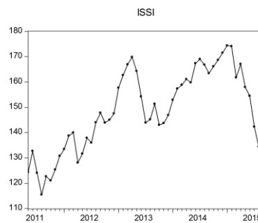
Gambar 1 Indeks Saham Syariah Indonesia (ISSI)

Walaupun masih terbilang baru, karena baru didirikan pada Mei 2011 tetapi perkembangan Indeks Saham Syariah Indonesia (ISSI) tiap periode cukup signifikan. Berikut pergerakan Indeks Saham Syariah Indonesia (ISSI) selama periode Mei 2011 hingga September 2015 yaitu: