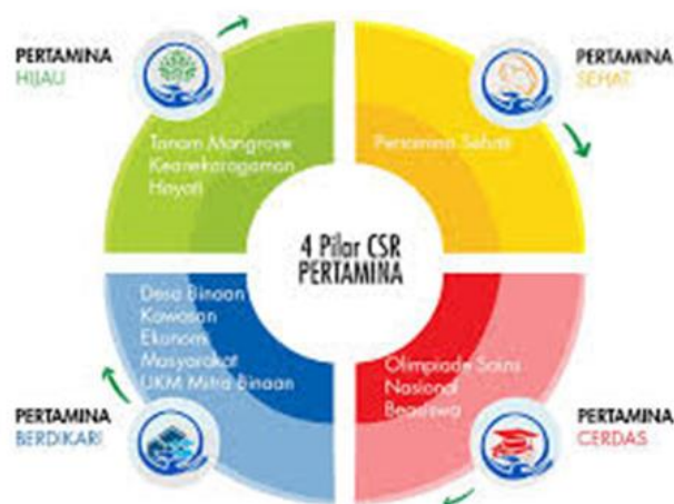
Gambar 2. 4 Pilar Utama CSR PT. Pertamina (Persero)

Di bawah payung tema “Pertamina Sobat Bumi”, PT. Pertamina (Persero) mengimplementasikan program CSR untuk tujuan CSR yang sesuai dengan konsep Tripple BottomLine , yang meliputi people, planet, and profit (3P). Tujuan ini menjadi fokus PT. Pertamina (Persero) dalam menjalankan operasinya, di mana produk-produk yang dikembangkan dan jasa yang diberikan peduli terhadap kelestarian lingkungan khususnya bumi untuk kepentingan dan masa depan generasi yang akan datang.