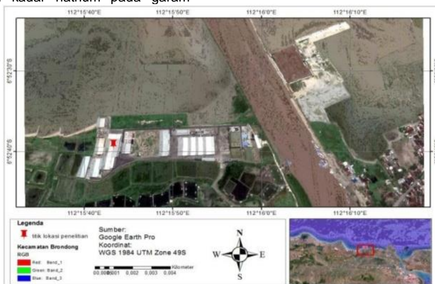
Gambar 1 Peta Lokasi Penelitian

Penelitian lapang dilakukan pada tanggal 1 Januari 2020 sampai 10 Januari 2020. Pengambilan sampel di Tambak Garam Prisma Lamongan dan analisa lanjutan di Balai Riset dan Pengembangan Industri Surabaya.