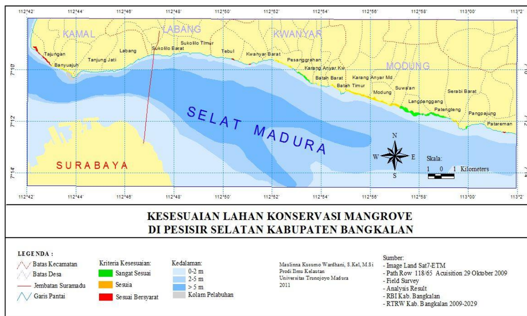
Gambar 1. Peta Kesesuaian Lahan Wisata Mangrove