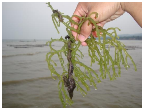
Gambar 2. Rumput Laut Yang Mengalami Infestasi Epifit

Bakteri yang dapat diisolasi dari rumput laut dengan gejala ice-ice adalah Pseudoalteromonas gracilis , Pseudomonas spp. dan Vibrio spp. Agarase dari bakteri merupakan salah satu faktor virulen yang berperan terhadap infeksi ice-ice (Largo et al. , 1995). Pemilihan spesies budidaya rumput laut perlu mempertimbangkan aspek teknis, musim pemeliharaan serta nilai ekonomisnya. Spesies rumput laut penghasil karaginan yang banyak dibudidayakan di Indonesia adalah K. alvarezii (varietas coklat dan hijau), E. denticulatum dan E. edule . Berdasarkan evaluasi yang dilakukan pada spesies rumput laut yakni K. alvarezii (varietas coklat dan hijau) dan E. denticulatum menunjukkan bahwa pertumbuhan rumput laut memberikan respon berbeda pada musim dan ice-ice (Parenrengi et al. , 2007). Pola pertumbuhan tahunan pada rumput laut yang dipelihara dengan metode long line di Kabupaten Polman, Sulbar disajikan pada Gambar 3.