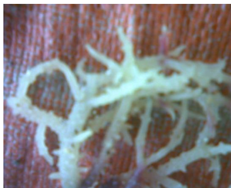
Gambar 1. Thallus Euclima Yang Terinfeksi Ice-Ice

Faktor predisposisi atau pemicu lain adalah serangan hama seperti ikan baronang ( Siganus spp.), penyu hijau ( Chelonia midas ), bulu babi ( Diadema sp.) dan bintang laut ( Protoneustes ) menyebabkan luka pada thallus . Luka akan memudahkan terjadinya infeksi sekunder oleh bakteri. Pertumbuhan bakteri pada thallus akan menyebabkan bagian thallus tersebut menjadi putih dan rapuh. Selanjutnya, pada bagian tersebut mudah patah, dan jaringan menjadi lunak yang menjadi ciri penyakit ice-ice . Infeksi ice-ice menyerang pangkal thallus , batang dan ujung thallus muda, menyebabkan jaringan menjadi berwarna putih (Gambar 1). Umumnya penyebarannya secara vertikal (dari bibit) atau horizontal melalui perantaraan air (Musa and Wei, 2008).