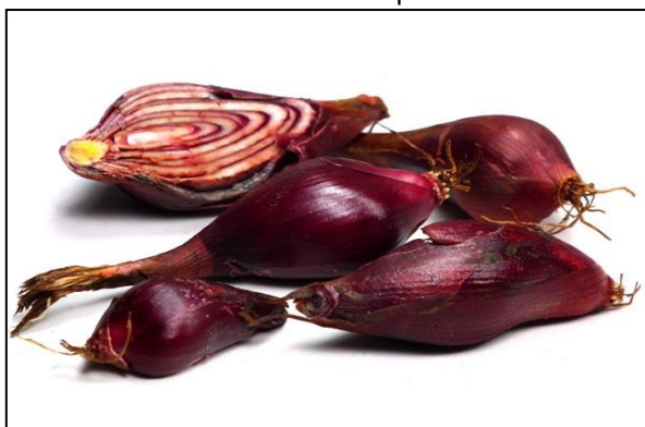
Gambar 1. Umbi Bawang Dayak

Bawang Dayak (Gambar 1.) memiliki bentuk seperti bawang merah, yaitu umbi lapis. Hanya saja untuk ukuran masih lebih besar bawang dayak dan untuk struktur lebuah tebal daripada bawang merah. Dimana di atas umbi tersebut terdapat daun berwarna hijau yang memiliki panjang 20 – 30 cm. Bawang dayak dapat hidup di daerah tropis, di Indonesia sendiri terdapat di Kalimantan dan Jawa.