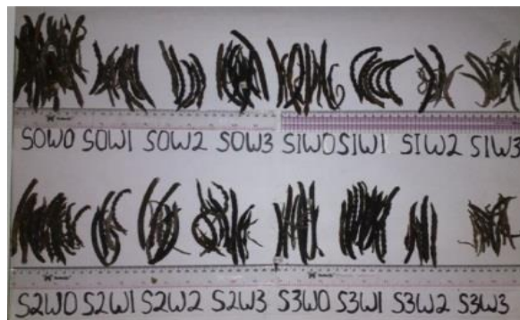
Gambar 4. 2. Polong Kering Hasil Panen

Cekaman kekeringan mulai stadia vegetatif dapat menurunkan berat kering tanaman sebesar 67,38%, stadia pembungaan sebesar 100,37%, dan stadia pengisian polong 44,25%. Stadia pembungaan menurunkan berat kering tanaman lebih besar dari pada stadia yang lain. Hasil ini berbanding lurus dengan pendapat Arsyadmunir (2016) yaitu kekurangan air selama fase pembungaan hingga pembentukan polong akan mengakibatkan penurunan produksi. Mirzaei et al. , (2014) juga melaporkan bahwa pengurangan jumlah irigasi secara tiba-tiba akan terjadi peningkatan suhu yang akan menyebabkan penuaan dini pada tanaman.